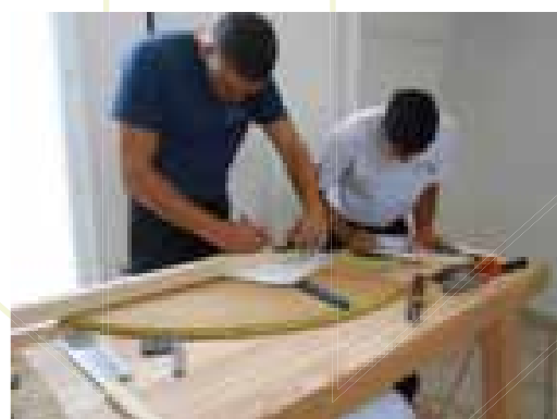
Jeunes compagnons menuisiers et tailleurs de pierres